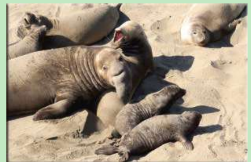
See-Elefanten bei San Simeon

Kalifornien bietet eine Reihe von besonderen Highlights, die keine Rundreise auslassen sollte. Schliessen Sie sich Travel Dream West für eine Tour an, die nebst den bekannten Orten auch auf wenig befahrenen Strassen Neues zeigt. Hier entdecken Sie Kalifornien in einer kleinen Gruppe von 9-12 Gleichgesinnten, von Individualisten, die Erlebnisse gerne mit neuen Freunden teilen, anstatt sich einer Busladung von Touristen anzuschliessen