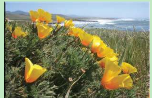
Küste von Big Sur