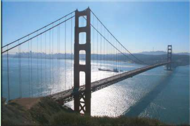
Golden Gate Brücke, im Hintergrund San Francisco